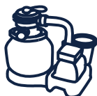
Groupe de filtration YZAKI 5,7m 3 /h